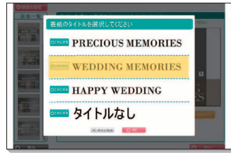
タイトルは4種類から選べます。