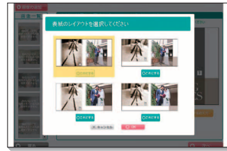
レイアウトは4種類から選べます。