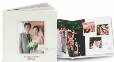
ナチュラルベーシック